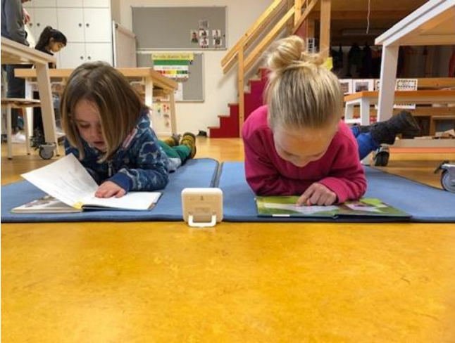
Vrij lezen in groep 3

We zijn in de groep aan het oefenen met het maken van + en - sommen tot 10 met een verhaaltje. Dat smaakte naar meer!