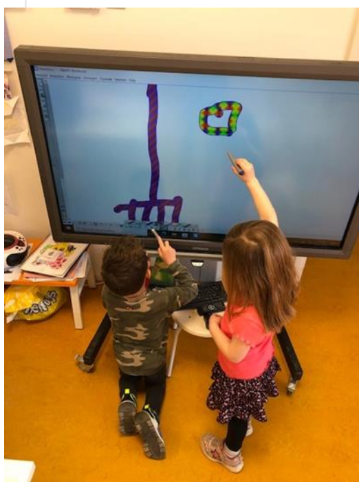
Hazel en Teun tekenen samen materiaal dat een boer gebruikt op de boerderij.