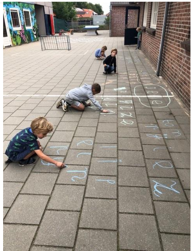
Groep 3 oefent met de schrijffletters en ze schrijven al echte woorden!