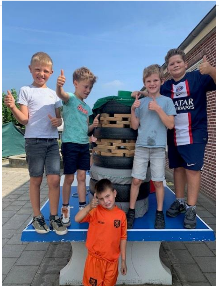
Teamwork tijdens het buitenspelen