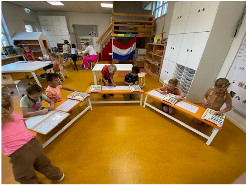
Groep 3 maakt kennis met het magneetbord en legt woorden en zinnen