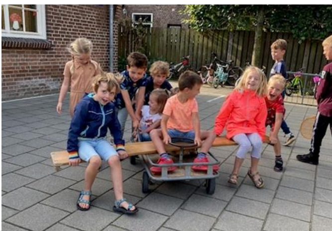
Samenwerken tijdens het buitenspelen