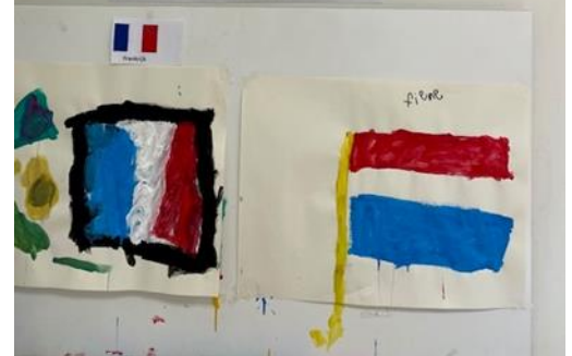
Deze week zijn we in groep 1-2-3 bezig het bekijken van de landen waar we zelf op vakantie zijn geweest. Verschillende kinderen hebben de vlag van hun vakantieland al geschilderd.