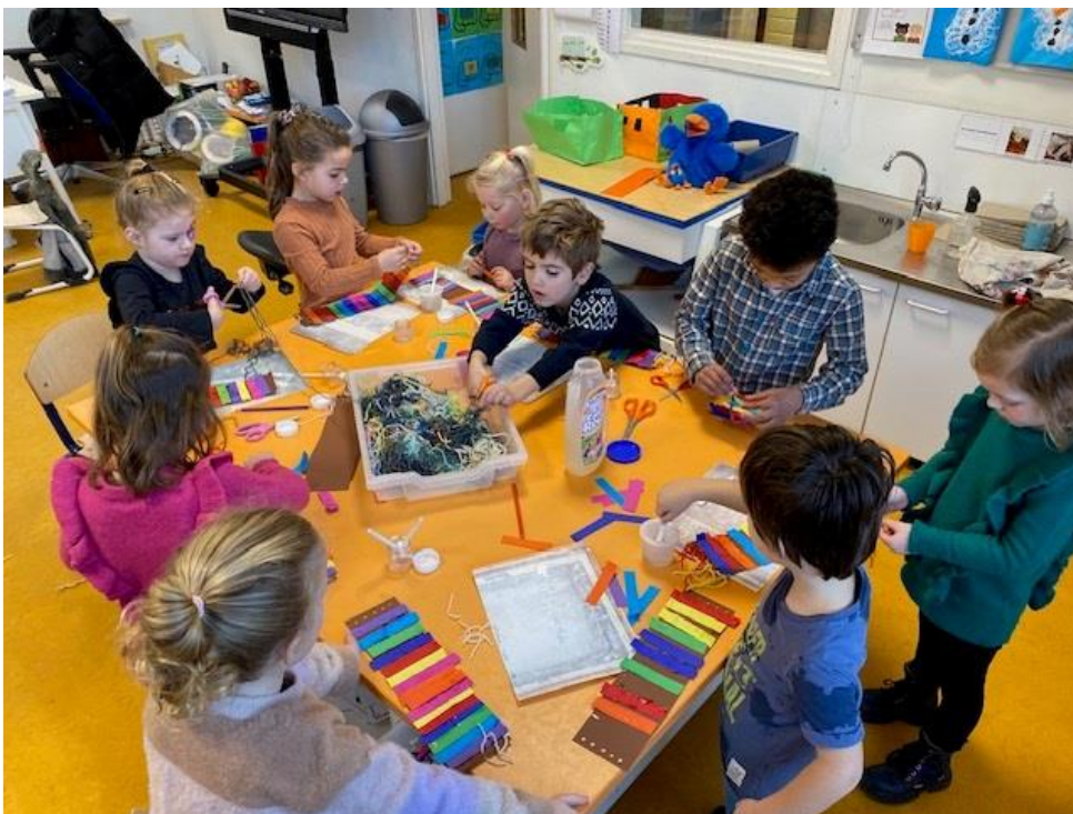
De kinderen van groep 1 en 2 maken een sjaal voor Raai de kraai en leren hiermee om symmetrisch te werken.

Heeft u leuke tips of ideeën voor 't Wijzertje, mail dit dan naar danielle.verhoeven@kansenkleur.nl